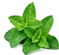
Minze Spitzen ca. x50