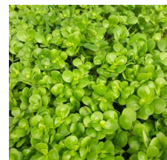
Salat Portulak ca. 1kg