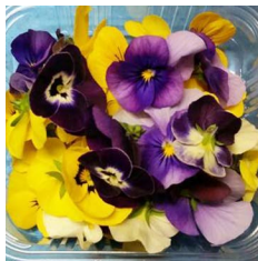
Blüten Veilchen x40