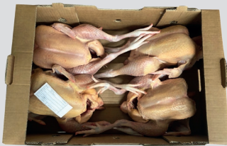
005911 Hühner im Ganzen BIO Pollo intero BIO Karton zu 9 kg | Cartone da 9 kg